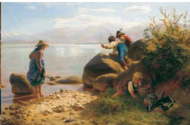
Fischende Kinder am Chiemsee, F. W. Pfeiffer (1822–1891)

Bayerns ältestes Kloster wurde um 640 gegründet, von 1215 bis 1808 war es Bischofssitz mit Dom. Als Ludwig II. 1873 die Herreninsel kaufte, ließ er in den barocken Klostergebäuden Wohnräume einrichten. 1948 tagte hier der Verfassungskonvent, der das Grundgesetz vorbereitete. Dieses wichtige Kapitel deutscher Geschichte ist im Museum dokumentiert. Weitere Räume veranschaulichen die reiche Geschichte des Klosters. Zwei Galerien zeigen Gemälde der Chiemsee-Maler. Ein Teil der königlichen Wohnräume ist authentisch eingerichtet. Der spätbarocke Bibliothekssaal von Johann Baptist Zimmermann und zwei hochbarocke Säle mit Illusionsmalereien lohnen allein schon den Besuch dieses bedeutenden Ortes bayerischer Geschichte.