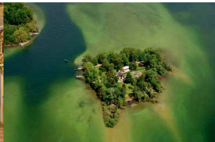
Die Roseninsel und ihre umgebenden Flachwasserzonen

Ludwig II. liebte diese kleine Insel mit dem pompejanisch ausgestatteten Casino seines Vaters. In jungen Jahren lud er besondere Gäste ein, wie etwa die russische Zarin Maria Alexandrowna. Manches Mal traf er sich dort mit der seelenverwandten Elisabeth, Kaiserin von Österreich. Der Rosengarten wurde mit vielen duftenden historischen Sorten rekonstruiert. Das Casino ist mit seiner feinen, aufwendig restaurierten Ausstattung zu besichtigen. Im Gärtnerhaus informiert eine kleine Ausstellung über die erstaunlich lange Geschichte der Insel. Die Überreste prähistorischer Pfahlbauten auf dem Grund des Starnberger Sees an der Roseninsel gehören zum Weltkulturerbe der UNESCO. In Sichtweite liegt am Ostufer des Sees die Votivkapelle. Sie wurde hoch über der Stelle errichtet, an der Ludwig II. am 13. Juni 1886 den Tod fand, unweit seines Schlosses Berg.