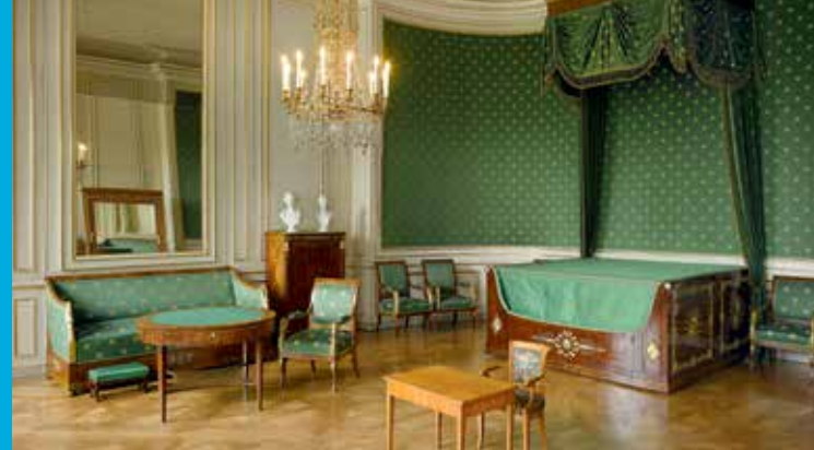
Das Geburtszimmer Ludwigs II. in Schloss Nymphenburg

Bayerischer Staatsminister der Finanzen, für Landesentwicklung und Heimat