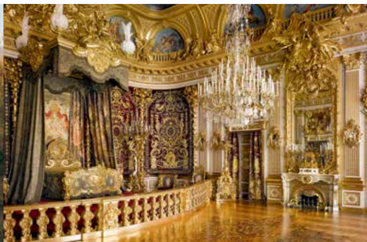
Paradeschlafzimmer in Schloss Herrenchiemsee

Seit 1878 entstand dieses Denkmal des Absolutismus, das sein Vorbild Versailles an Pracht der Ausstattung weit übertrifft. Das Paradeschlafzimmer im Großen Appartement gilt als der teuerste Raum des 19. Jahrhunderts. Die Porzellanausstattung des Kleinen Appartements ist der größte Einzelauftrag, den die Manufaktur Meissen je erhalten hat. Die Stickereien der Textilien suchen in Fülle und Qualität ihresgleichen. Ludwig II. hat in diesem Schloss mit aller Konsequenz und mit allen Mitteln das Königtum beschworen. Es blieb ebenso unvollendet wie der umgebende Park nach Versailler Vorbild mit seinen grandiosen Wasserspielen, der den Großteil der Insel umfassen sollte und heute von freier Natur mit wichtigen Biotopen umgeben ist. Im Schloss dokumentiert das umfangreiche Ludwig II.-Museum Leben und Wirken dieses »einzigsten wahren Königs des 19. Jahrhunderts«, wie Paul Verlaine ihn 1886 nannte.