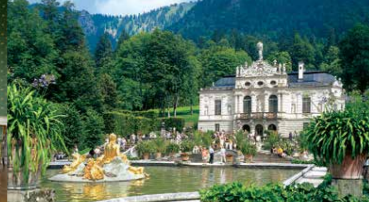
Hauptfassade von Schloss Linderhof