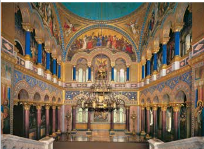
Thronsaal in Schloss Neuschwanstein

Von Ludwig II. seit 1868 hoch über dem Schloss Hohen Schwangau seines Vaters in vertrauter Umgebung errichtet und nie vollendet, war Neuschwanstein für ihn Denkmal der Kultur und des Königtums des Mittelalters, die er verehrte und nachvollziehen wollte. Das Schloss, das zwar in mittelalterlichen Formen, aber mit damals modernster Technik gestaltet und ausgestattet wurde, zählt zu den weltweit bekanntesten Bauwerken und ist ein Hauptsymbol des deutschen Idealismus. Die Innenräume zeigen Wandbilderzyklen aus altnordischen und ritterlichen Sagen. Der Sängersaal zitiert verehrend zwei Säle der Wartburg, der Thronsaal – ein Kultraum des Herrschertums – byzantinische und frühchristliche Kirchenräume.